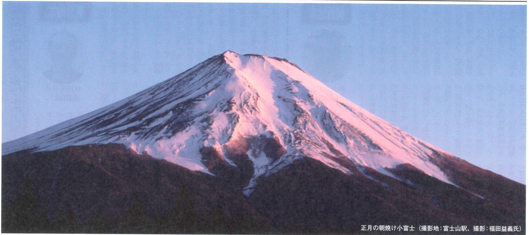
正月の朝焼け小富士 (撮影地:富士山駅、撮影:福田益義氏)

発行人 新産別運転者労働組合 (略称・新運転) 編集兼発行人 太田 武二 〒110-0003 東京都台東区根岸3-25-6 TEL 03-5603-1300 FAX 03-5603-5300 mail: sinunten@sinunten.or.jp