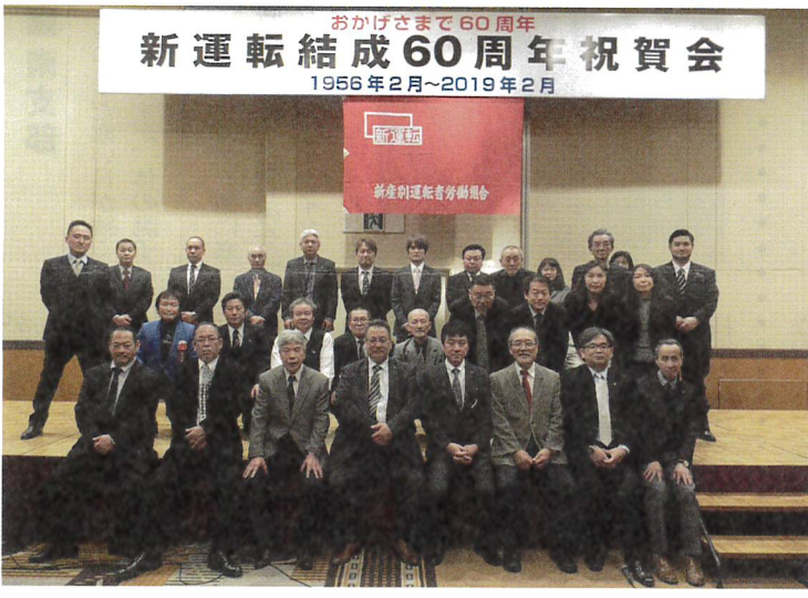
おかげさまで60周年 新運転結成60周年祝賀会 1956年2月～2019年2月