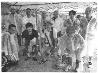
辺野古テントの中

これまで中央本部と東京地本の活動方針の「平和と民主主義を守る」項目で、沖縄辺野古新基地建設反対を決定してきた中で、3月の第29回全国大会で「沖