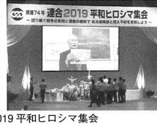
原水禁世界大会・長崎 黙祷 平和大行進 被爆74年・連合2019平和ヒロシマ集会